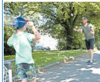
Partie im Park: Federballspieler am Hohenschwangauplatz.